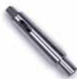
CONOS DE REDUCCIÓN